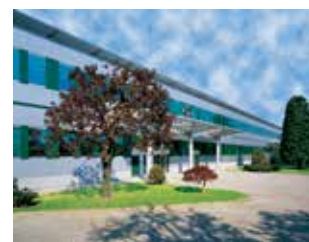
ミラノ ノバーテ工場

約 1,000 種類 200 万個以上の在庫を常備し、柔軟に納期対応を行っております。