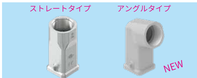
ストレートタイプ アングルタイプ M25 対応 大口径フード 動力ラインとブレーキラインをまとめて収容可能な大口径フード ストレートタイプに加え、アングルタイプが新発売されました