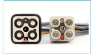
CQ4 03/2 動力+ブレーキコネクタ

産業用角型コネクタは、電気安全規格・高い IP 保護・耐ノイズ性・低接触抵抗・高い接続信頼性といった動力接続に求められる性能に対応しています。