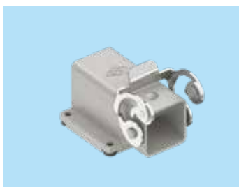
4方向取付対応ハウジング 等間隔ピッチ固定で 90°毎 4方向に取付変更が可能

動力用の太径電線も余裕を持って収納する M25 ケーブルエントリーに対応したフードや、取付方向を 90°ピッチで変更できるモーター用ハウジングなど、幅広いエンクロージャラインナップをご用意。ご用途に応じた最適な接続方法をご提案いたします。